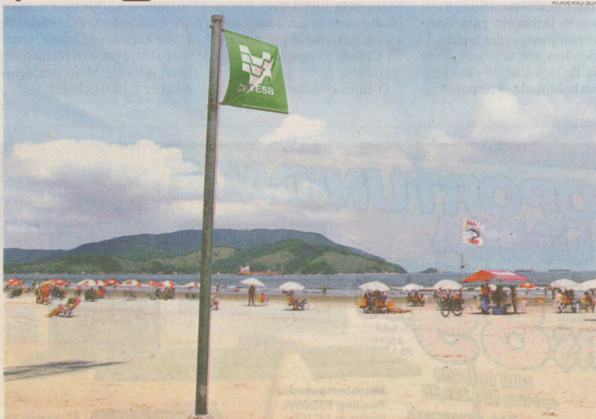
Em Santos, as amostras de água do mar são colhidas sempre às segundas e quartas-feiras

O Laboratório de Controle Ambiental é aberto ao público. Estudantes e demais interessados podem agendar visita monitorada pelo telefone 3289-3674. O horário de funcionamento é de segunda a sexta-feira, das 8 às 12 h e das 14 às 18 h. Aos sábados e domingos, das 10 às 15 h.